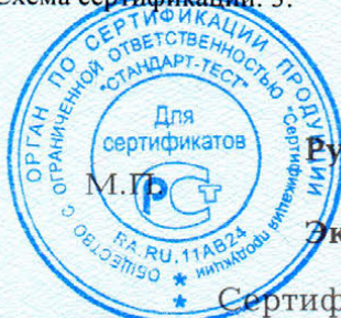
Схема сертификации: 3.

ДОПОЛНИТЕЛЬНАЯ ИНФОРМАЦИЯ Инспекционный контроль: ноябрь 2017г., ноябрь 2018г.